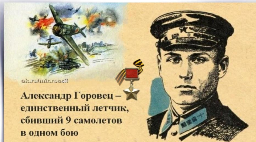
Александр Константинович Горовец (12 марта 1915 — 6 июля 1943) Герой Советского Союза.

6 июля 1943 года, на 2-й день Курской битвы, возле хутора Зоринские Дворы, гвардии старший лейтенант Горовец на самолете Ла-5 совершил невероятное: в одном воздушном бою сбил 9 бомбардировщиков врага! Последнему «юнкерсу» обрубил хвост винтом – кончился боезапас. В этом боевом вылете герой погиб.